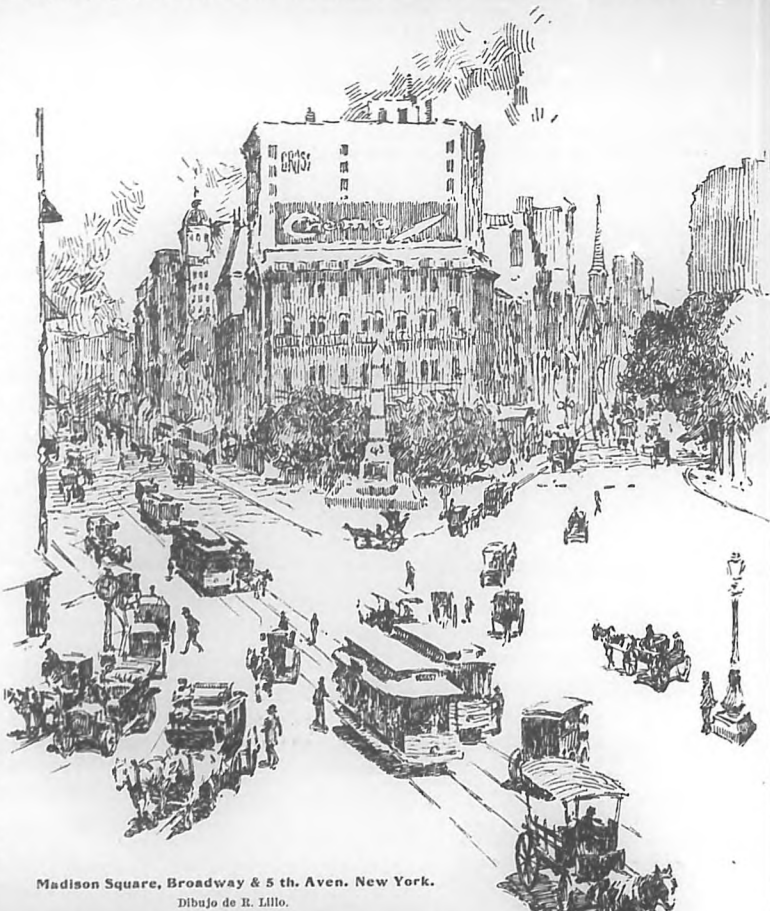
Madison Square, Broadway & 5 th. Aven. New York.