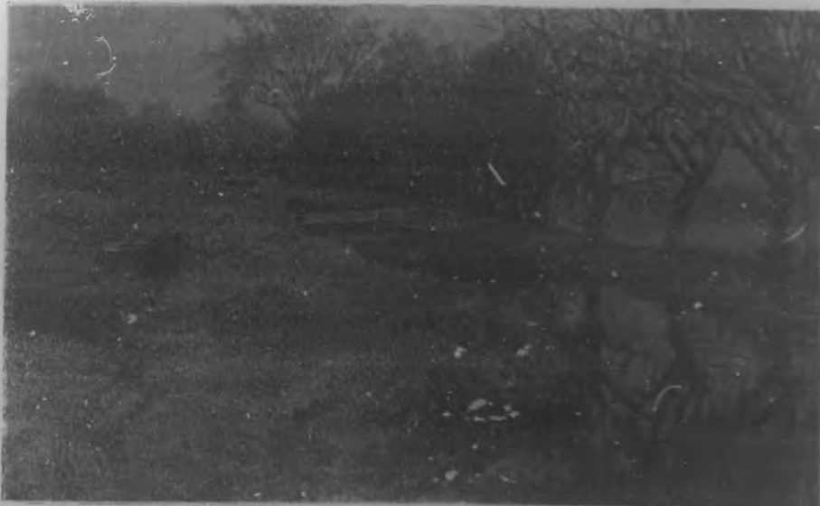
Dibujo a la pluma por Rafael Lillo.