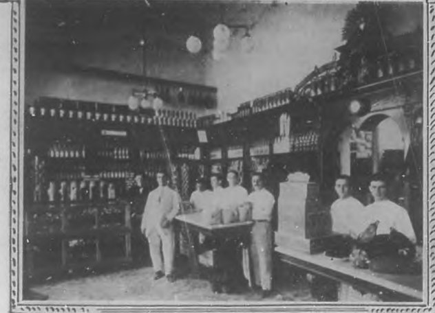
Panadería de Santa Teresa.—Vista exterior del establecimiento, del despacho de panadería, dulcería y viveres finos, y del edificio que da á la calle Villegas en el cual viven los operarios y empleados de la casa.

Todos recordamos la poco escrupulosa manipulación á que el pan está sujeto hasta el momento de entrar en nuestras casas.