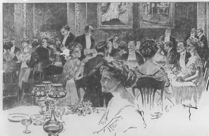
Fiestas del centenario.—Banquete Presidencial en el Casino Español de Méjico.—Dibujo de R. Lillo.

publicamos de diversos trabajos de Lillo darán idea á aquellos de nuestros lectores que no lo conozcan, cuán cierto es lo que decimos referente á la soltura y seguridad con que abarca diversos géneros el notable artista, tan notable como modesto.